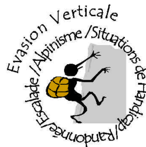
Table Ronde Alpinisme et Situations de Handicap Mercredi 30 mars 2005 de 14h à 17h / Halle Tony Garnier Lyon

RELIANCE Collectif de Recherche Situations de handicap, Education et Sociétés Université Lyon 2